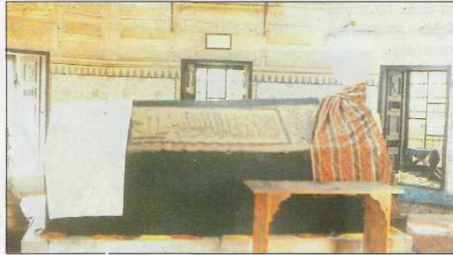
Kaanûnî Sultan Süleyman döneminde, Balkan fetihlerinde büyük yararlıklar gösteren ve iki defa Bosna Sancakbeyliği'ne getirilen Gazi Husrev Bey'in Saraybosna'daki camii ve türbesindeki sandukası.

maz. Ama 1683'e kadar daha epey önemli akın hareketine rastlanır. Bir veya birkaç akını anlatmak, konunun dışındadır.