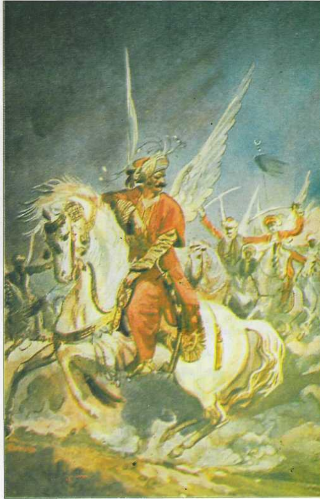
Merhum ressam Münif Fehim'in "Akıncılar" tablosu.

rupa'nın en âlâ süvarisi Osmanlı süvarisidir" ibaresi düşülmüştür (Cevdet Paşa, IV, 325). Varın 15. ve 16. asırlarda Osmanlı akıncısının nasıl at bindiği-