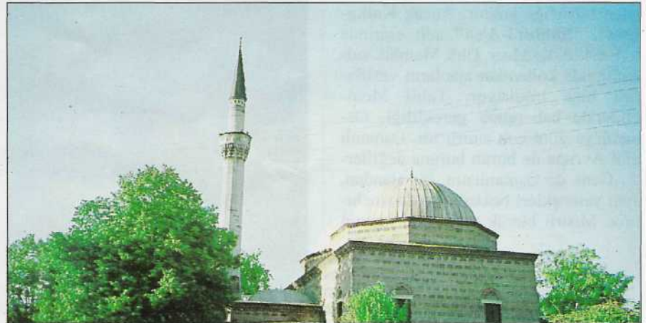
Üsküp'te Gazi İsa Bey tarafından yaptırılan İsa Bey Camii, 520 yıllık bir yapı.

Akınlarda büyük ganimet elde ediliirdi. Zaten ocağın gayesi, düşmanı iktisaden çökertip, muntazam Osmanlı ordusu için olgun meyve hâline getirmek veya Osmanlı'ya sataşmaktan alı-