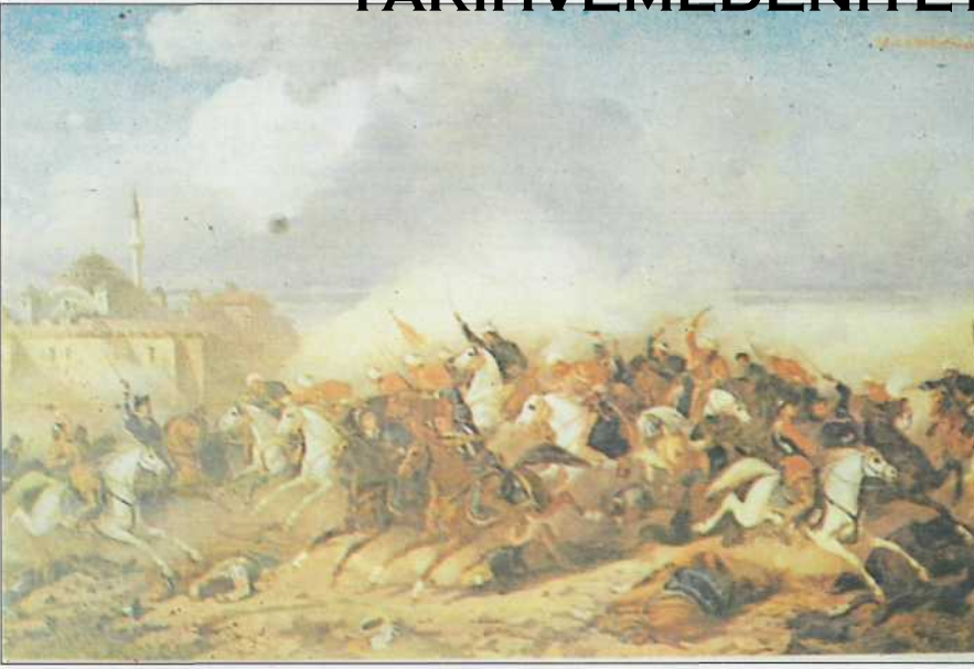
Osmanlılar'ın atlı komandolan akıncıların Belgrad kalesine hücumu.

ka birkaç, en az bir Balkan ve Avrupa dilini Evliyâ Çelebi'nin tabiriyle İnce konuşmak ", yani telaffuz yanlış yapmamak mecburiyetindedir. Zira ocağın çok önemli ikinci görevi, haber alma'dır . Dîvân-ı Hümâyûn (Osmanlı imparatorluk bakanlar kurulu), istihbarat görevlerinde, akıncı ve korsan subaylarını kullanır. Bunları, Avrupalı kimliğinde Avrupa ülkelerine salar.